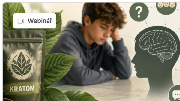
iPREV webinář: Kratom u

Nemůžete se zúčastnit živého vysílání? Nevadí. Všechny webináře jsou dostupné i ze záznamu. Informace o plánovaných webinářích i záznam již proběhlých naleznete níže v sekci Webináře.