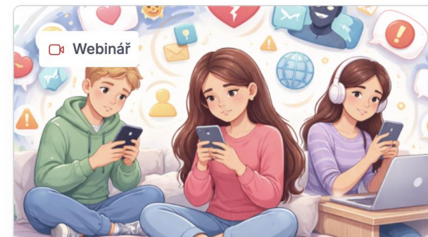
iPREV webinář: Děti,