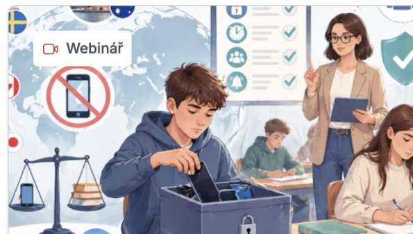
iPREV webinář: Regulace