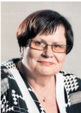
Marie Benešová (od 6. 5. 2019)