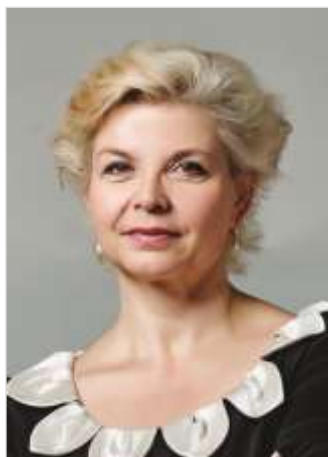
Daniela Kovářová (8. 5. 2009 – 2. 12. 2009)