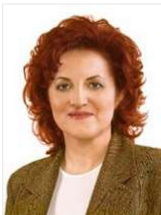
Vlasta Parkanová (7. 1. 1997 – 5. 1. 1998)