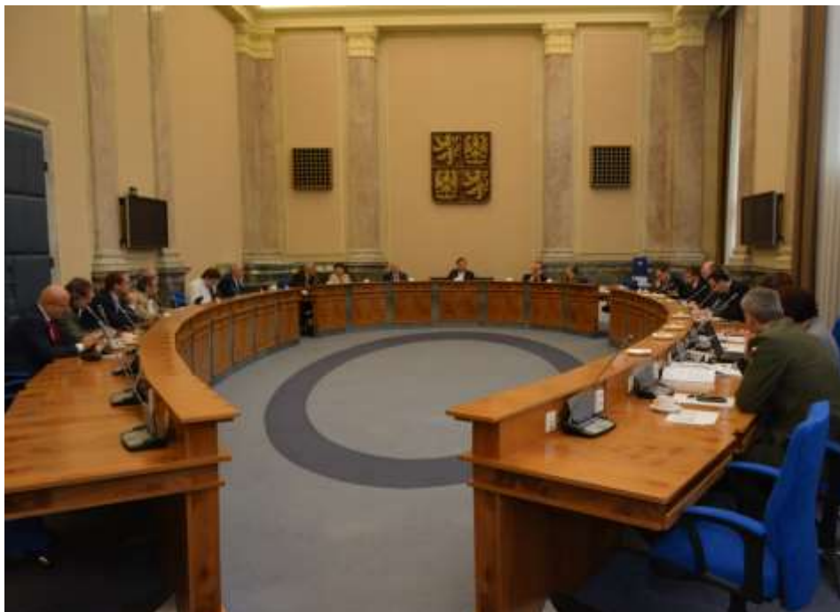
Zasedací sál vlády České republiky, zasedání Legislativní rady vlády dne 26. října 2017.

začnící jednotka Úřadu vlády České republiky, jehož vedoucí byl sice označován jako sekretář Legislativní rady, nicméně nebyl ani členem Legislativní rady, ani přímo podřízen jejímu předsedovi.