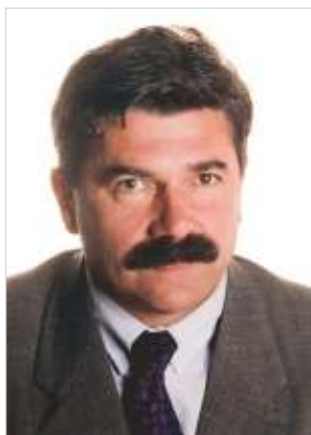
Jan Kalvoda (17. 7. 1992 – 7. 1. 1997)