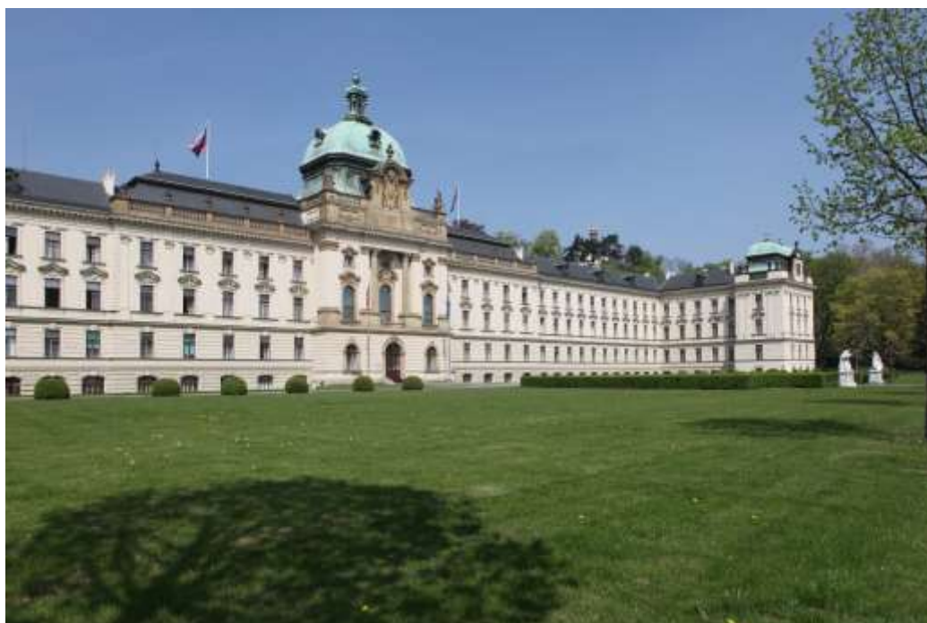
Strakova akademie – jedna z budov Úřadu vlády České republiky.

Kromě stanovisek ke konkrétním legislativním návrhům Legislativní rada zaujímá stanoviska k závěrům svých pracovních komisí nebo Odboru kompatibility Úřadu vlády (OKOM) 13 přijatým k návrhům vyhlášek, pokud zpracovatel návrhu vyhlášky vyjádří nesouhlas s jejich závěry, a přijímá stanoviska i v dalších případech, rozhodne-li tak vláda nebo předseda Legislativní rady. Legislativní rada se rovněž vyjadřuje k návrhům legislativních pravidel vlády a k návrhům jejich změn. 14