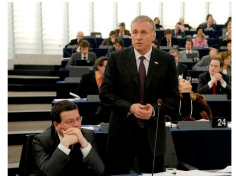
(předseda Rady EU Mirek Topolánek v Evropském parlamentu)

... Mirek Topolánek, předseda Rady Evropské unie